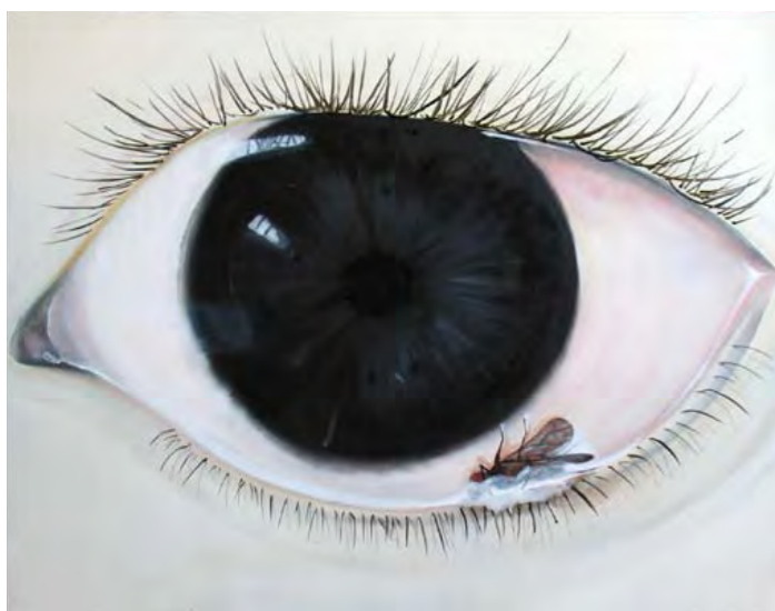
Dawid Czych, Oko , olej, płótno, 90 x 110 cm, 2009

Debiutował w Zderzaku udziałem w letniej wystawie „Science&Fiction” (2009). Pokaże obrazy z lat 2008-2009.